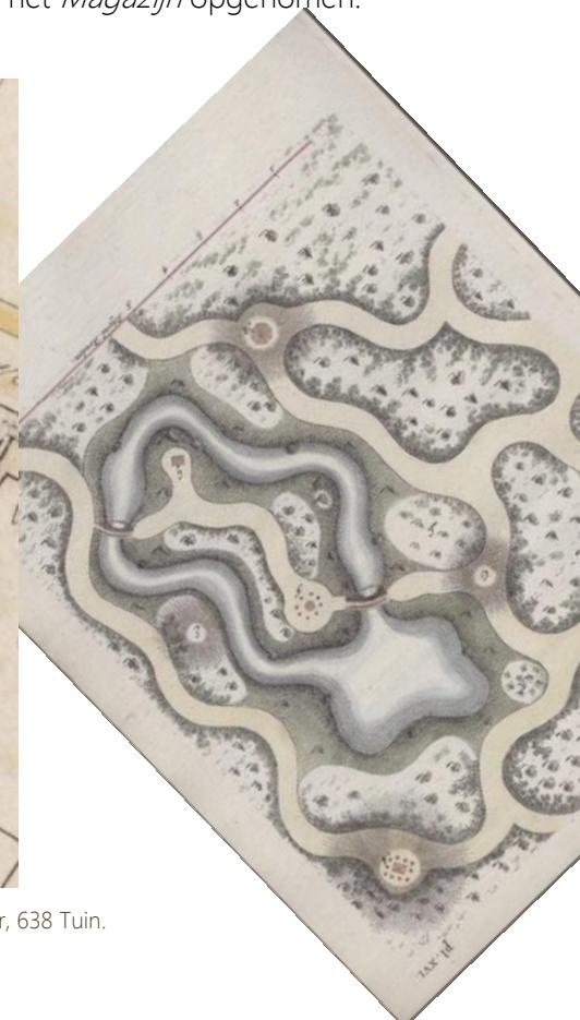
Bij afb. 1.: 632 koepel, 633 water als erf, 634 Tuin als erf, 635 Water als erf, 636 Koepel, 637 Schuur, 638 Tuin.